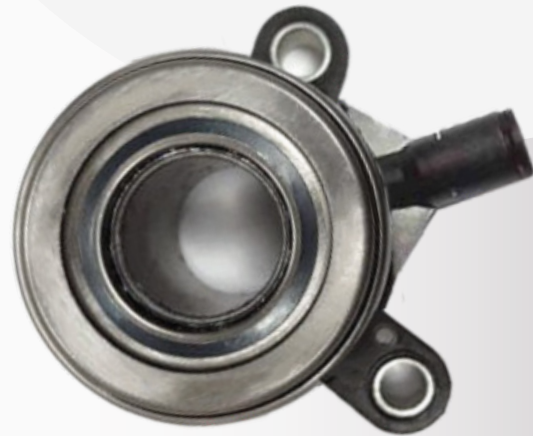
Producto NO Cartek

B) Producto que no sea comercializado por Perfection de México: