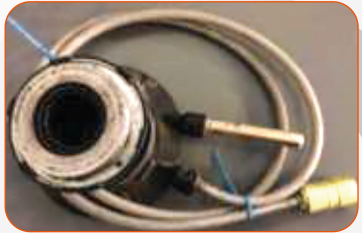
EC-GM30H con manguera NO TechLink

B) Producto que no sea comercializado por Perfection de México: