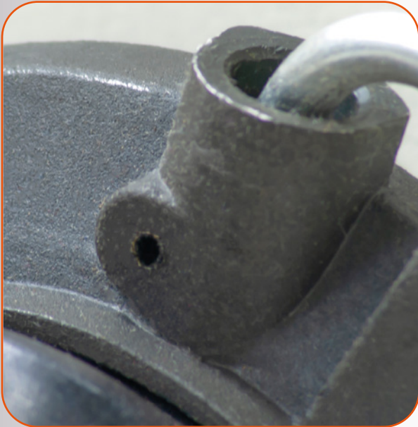
Perno de sujeción removido (deformado)