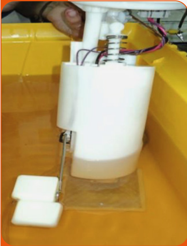
Bomba con vaso vacío.