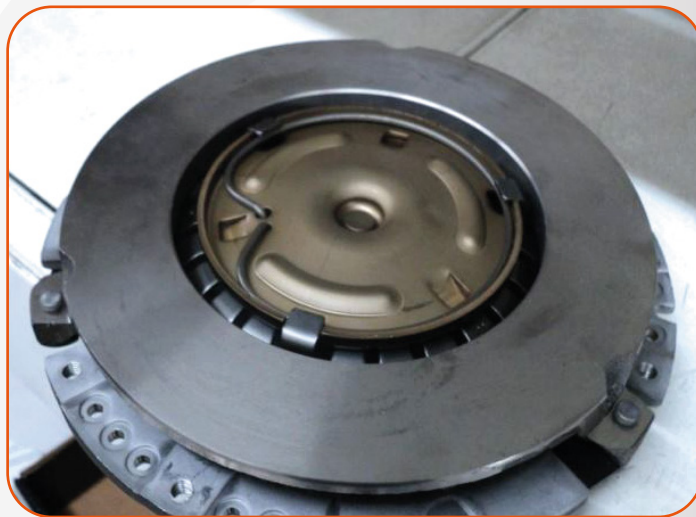
Plato de empuje del diafragma Clutch desarmado.

Esto solo sucede cuando el clutch aún no ha sido instalado, una vez hecho conforme se aprieta el plato de clutch al volante de inercia, la posición del diafragma cambia y por consiguiente el platillo / arillo de empuje se modifica hacia la parte interna del plato de clutch.