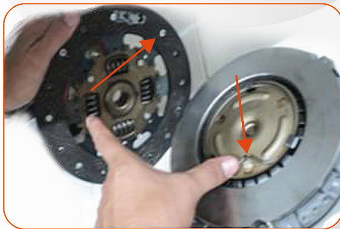
Estos dos puntos entran en contacto al girar.